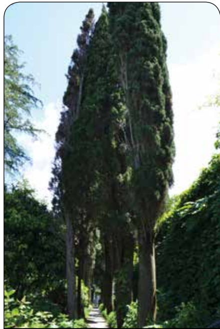
Sett gjerne av litt tid til meditasjon og ettertanke i den idylliske og velstelte hagen i Villa San Michele.

verden over, er salat fra Capri, bedre kjent under navnet Caprese-salat. Den består av Mozzarella-skiver (helst laget av bøffelmeik) og tomater strødd over med basilikumblader og selvsagt kaldpresset, lokal olivenolje. Hjemmelaget Ravioli Caprese laget med caciottaost, parmesan og merianurt er en annen herlig, stedlig rett. Ellers finnes det utallige herlige fiskeretter man kan velge imellom, ofte saltvannskokt fisk med masse tomater. Som dessert kan du ikke unngå å prøve capresekaken laget av mandler og sjokolade med et snev av vaniljesaus. Da hører det med et lite glass av limoncello, en herlig avkjølt sitronlikør fra selveste Capri.