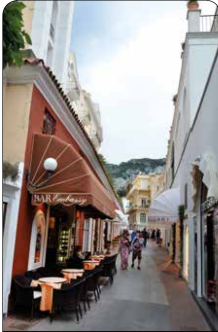
På Capri finner du også de mest fasjonable kafeer, restauranter og eksklusive butikker.

du leie deg et helikopter gjennom Capri-Helicopters som flyr deg direkte til Capri, men for folk flest er det greit å ta en taxi til kaia Molo Beverello. Husk å avtale pris på forhånd! Derfra tar du en hydrofoillbåt til Capri, som bruker en kort time.