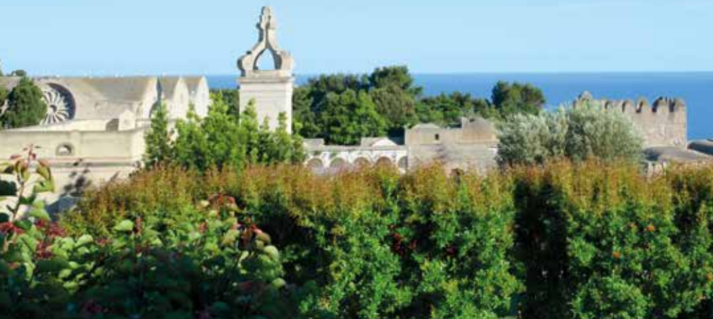
Den storslåtte utsikten fra Augustus-parken, som du så absolutt bør besøke.