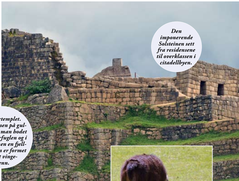
Den imponerende Solsteinen sett fra residensene til overklassen i citadellbyen.

Under Soltempelet er det en hule som kalles Det Kongelige Mausoleum hvor det finnes symbolske trapper, nisjer hogget i fjellet for plassering av mumier og et sted hvor sollyset kommer inn om morgenen, men kun på vintersolverv.