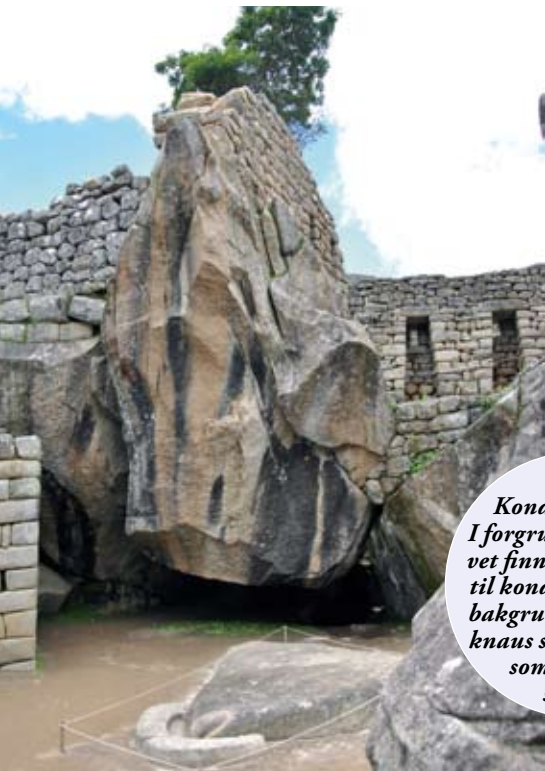
Kondortemplet. I forgrunnen på gulvet finner man hodet til kondorfuglen og i bakgrunnen en fjellknaus som er formet som et vingespenn.