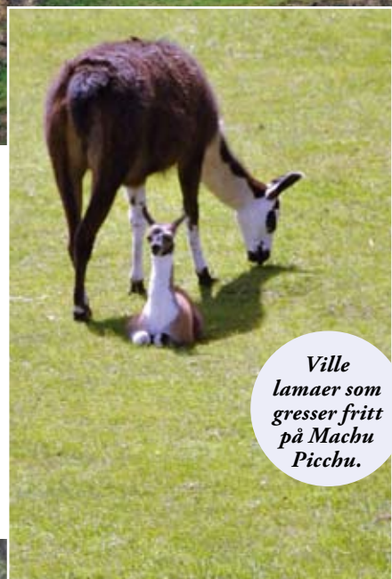
Ville lamaer som gresser fritt på Machu Picchu.

gemer og andre hellige steder i horisonten. I dag blir plassen benyttet av forskjellige spirituelle grupper for åndelige ritualer, blant annet av lokale sjamaner som feirer seremonier rundt vintersolverv.