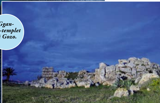
Ggantija-templet på Gozo.