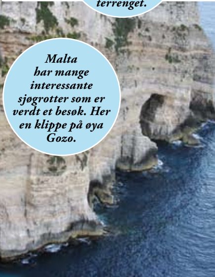
Malta har mange interessante sjøgrotter som er verdt et besøk. Her en klippe på øya Gozo.