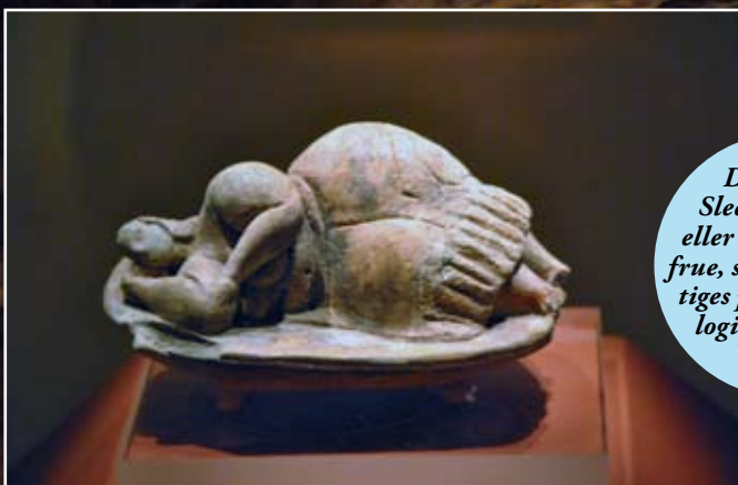
Den vakre Sleeping Lady, eller Den sovende frue, som kan besiktiges på det arkeologiske museet i Valletta.

På grunn av fuktskader er stedet avsperrt gjennom et spesielt lufteanlegg, og det slippes kun inn ti personer av gangen. Har du tenkt deg hit, bør du kjøpe billett flere måneder i forveien på www.maltaticket.com . Det er en åndelig og kulturell opplevelse du sent vil glemme. ■