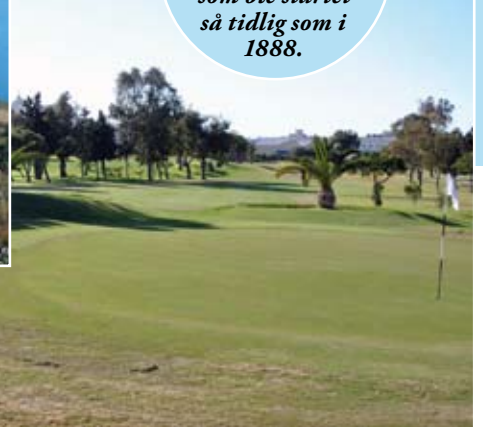
For de golfinteresserte finnes The Royal Malta Golf Club, som ble startet så tidlig som i 1888.

kosmisk inndeling av stjerner som antyder at de hadde stor interesse for universet. Antagelig har tempelet blitt bygget som et flerbrukelig hellig sted for å vise lydighet, respekt og ærbødighet overfor en kosmisk guddommelig kraft.