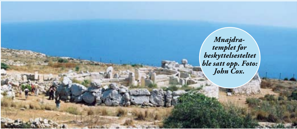
Mnajdra-templet for beskyttelsesetlet ble satt opp.