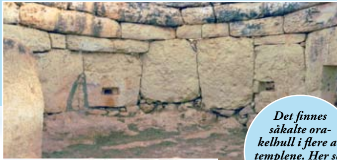
Det finnes såkalte orakelhull i flere av templene. Her ser vi to slike i Mnajdra-templet.