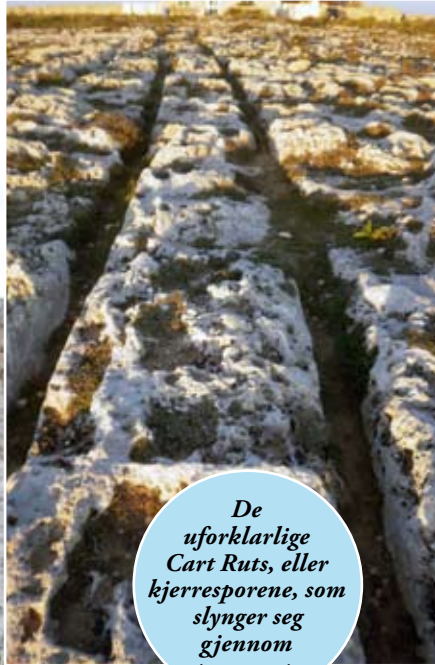
De uforklarlige Cart Ruts, eller kjerresporene, som slynger seg gjennom terrenget.