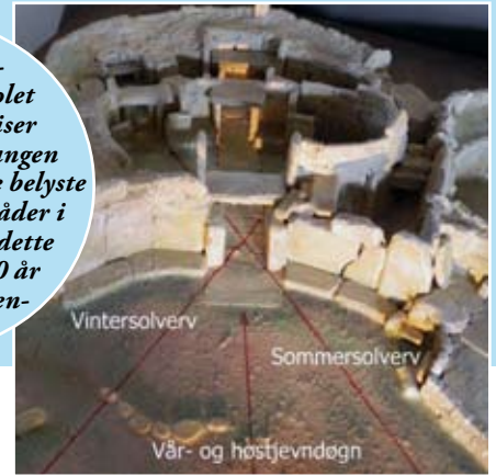
En gipsavstøning av soltemplet Mnajdra som viser hvordan soloppgangen ved de fire årstidene belyste helt bestemte områder i templet. Eller er dette kanskje en 6000 år gammel solkalender?

kan være Malta. Om det er slik, er uvisst. Men at det er noe magisk og uforklarlig ved denne lille middelhavsøya, er mer enn hva tilfeldigheter tilsier.