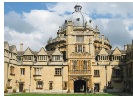
Brasenose College, Oxford

nordmenn. Et av disse var; « Vil Norge slå Brasil i 1998 World Cup » Hvilket jeg svarte, YES! Og det ble jo også utfallet til mange stores forundring.