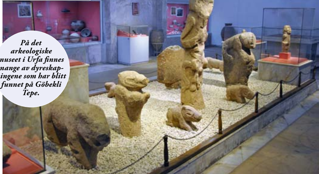
På det arkeologiske museet i Urfa finnes mange av dyreskapingene som har blitt funnet på Göbekli Tepe.