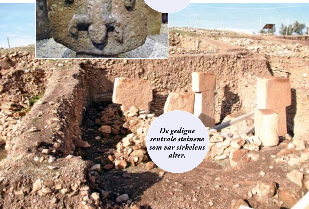
De gedigne sentrale steinene som var sirkelens alter.