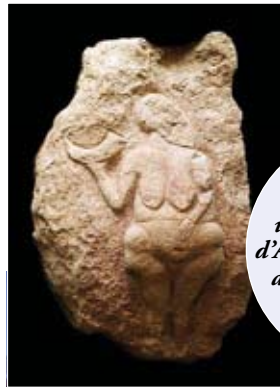
Venus fra Laussel, utstilt ved Musée d'Aquitaine i Bordeaux.

Foreløpig er det gratis adgang, men man gir gjerne noen tyrkiske lira til den unge guiden som tar deg med rundt. At han ikke kan engelsk, oppveies av hans ivrige armbevegelser og velvillige serviceinnstilling. For øvrig er det hans far som eier jorda hvor denne utrolige kulturskatten ligger. Men husk å gå på toalettet før du kommer