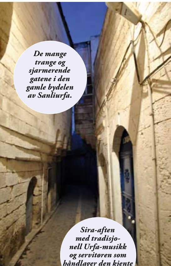
De mange trange og sjarmerende gatene i den gamle bydelen av Sanliurfa.