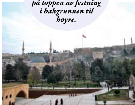
Parken som er målet for de mange pilgrimmene som kommer til Sanliurfa. De berømte korintiske kolonnene kan sees på toppen av festning i bakgrunnen til høyre.

Etter en kort, men bratt gangtur fra parken rett bak Abrahams fødested, kommer man til byens gamle festning og bymurene. Herfra er det en fantastisk utsikt over hele Urfa, hvor man kan se minaretene til de mange moskeene i byen. Her finnes også to 17 meter høye og imponerende korintiske kolonner eller søyler, som ifølge sagnet også virket som en katapult eller slynge. Det hersker mange fortellinger rundt disse søylene. Én av dem går ut på at det var herfra den grusomme kongen Nimrod slyngte Abraham ut i ilden. En annen er at de ble bygget til ære for dronning Salmeth, som det står skrevet om på gammelsyrisk, et av de urgamle, lokale språkene. En tredje variant er at de ble satt opp som minnesmerker da festningen og bymuren ble bygget i år