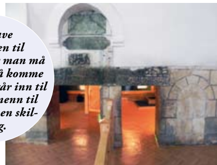
Den lave inngangen til grotten, hvor man må bøye seg for å komme inn. Damer går inn til venstre og menn til høyre, med en skillevegg.

Det er i Urfa flyplassen ligger – utgangspunktet for alle reiser i området. Det er en sterk kontrast mellom den gamle og den nye bydelen. Den gamle delen er av de mest særegne og sjarmerende i hele Tyrkia med sine mange trange gater og hjørner hvor kun moped og folk til fots har mulighet til å komme frem. Den gamle basaren er et naturlig samlingssted hvor lokale handelsmenn kledd i tradisjonelle klær selger sine ferske matvarer, tepper, pyntegenstander eller hva det måtte være av lokalt håndverk. (Bilde 15 og 16) Her føler du faktisk den sanne orientalske atmosfæren, noe som jeg synes mangler i Den store basaren i Istanbul, selv om den