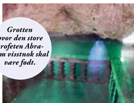
Grotten hvor den store profeten Abraham visstnok skal være født.

Høydepunktet på kvelden er når du blir servert en ekte håndlaget rett, tilberedt foran øynene. Det er den samme retten som profeten Abraham spiste i sin tid, og en form for sterkt krydret dessert. I dag finnes det turistattraksjonsvarianter av Sira Gecesi, som kalles Sira Night – det er absolutt verdt et besøk.