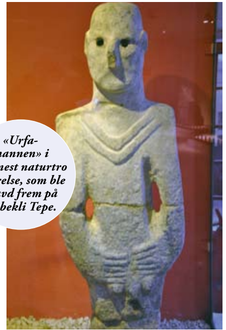
«Urfa-mannen» i nærmest naturtro størrelse, som ble gravd frem på Göbekli Tepe.

hit. Noe så moderne finnes nemlig ikke i mils omkrets!