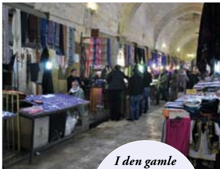
I den gamle basaren i Sanliurfa kan man få kjøpt det meste. Men ikke glem å prute!