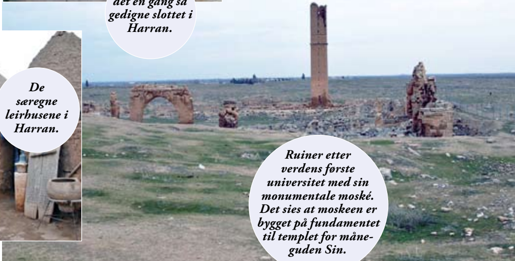
Ruiner etter verdens første universitet med sin monumentale moské. Det sies at moskeen er bygget på fundamentet til templet for måneguden Sin.