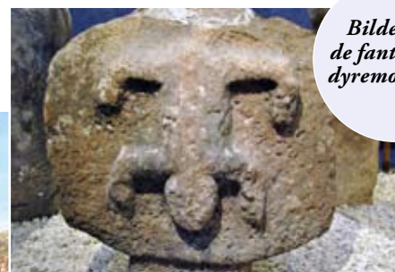
Bilder fra de fantastiske dyremotivene.