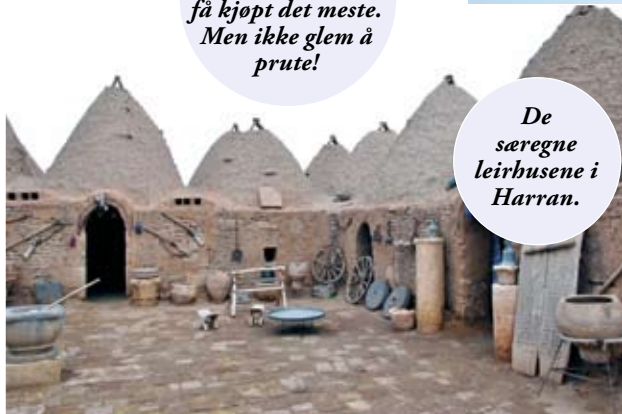
De særegne leirhusene i Harran.