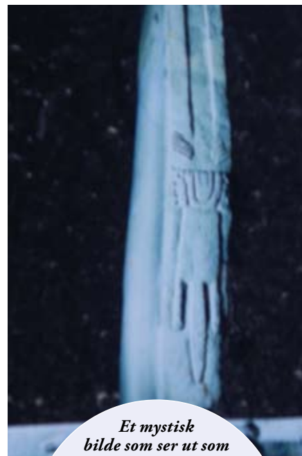
Et mystisk bilde som ser ut som et nattbilde, men det er tatt midt på dagen. Helt utrolig og nesten skremmende. Ønsket universet å vise sin tilstedeværelse gjennom dette bildet? Vi ser en arm, hender, antagelig solmotiver og ender som beveger seg fra øst til vest. En kosmologisk betydning, antagelig.