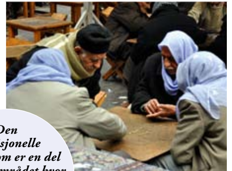
Den tradisjonelle kafeen som er en del av basarområdet hvor mannfolk møtes for å spille en form for et terningspill

Siden den alltid har vært en frodig by, har den også blitt underlagt mange herskere, blant andre akkaderne, sumererne,