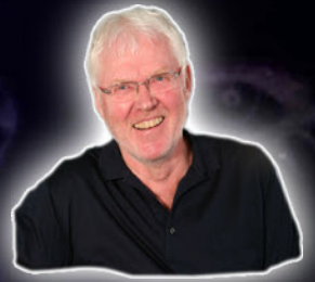
Skrevet av: Tore Lomsdalen